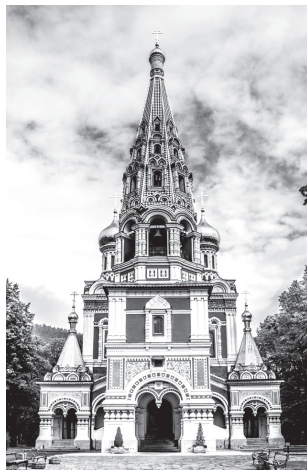
Храм Рождества Христова