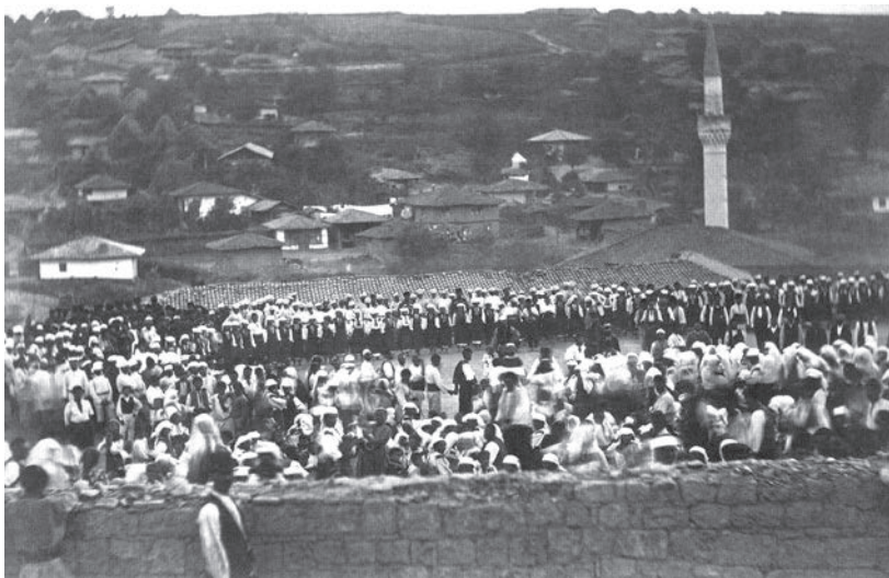
Болгарский праздник в Бяле, сентябрь 1877 г.

— Осада Плевны стоила России такого количества убитых и раненых, что волосы дыбом встают. Так что турки воевали очень хорошо. И, кстати, у них было лучшее обмундирование и лучшее вооружение. Они воевали на своей территории, у них были хорошая логистика и налаженное снабжение. А русские войска намеревались совершить летний поход: дойти до Балкан и остановиться. Поэтому и не готовились к длительной войне, тем более в зимних условиях. В итоге русские солдаты просто замерзли на Шипке.