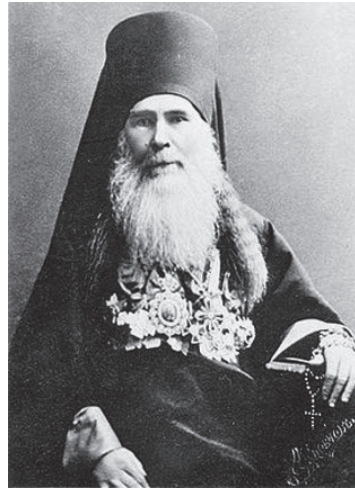
Епископ Макарий (Миролюбов)

му должны оставаться навсегда при своем русском, восточном православии, чуждом всякого увлечения земного. Мы помним бедствия свои от монголов и ляхов и состраждем другим в подобных бедах и напастьях. Нам подан Евангельский пример в лице сердобольного Самарянина, помогшего впадшему в разбойники. Несмотря на то, что Самарянин был другой веры, другого племени и языка, он помог с сердечным участием пострадавшему, как своему ближнему, забыв всякую племенную рознь и вражду. А страждущие теперь славяне не только одной с нами веры, но и одного рода и племени, одного языка и происхождения. Глас убиенных братьев наших вопиет к нам от земли и требует нашей кровной защиты.