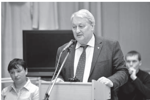
Генерал-лейтенант СВР Л.П. Решетников (Москва)

— В свое время, говоря о нашей стране, президент Франции Жак Ширак заявил: «Россия — это не Восток и не Запад, — напомнил Леонид Решетников. — Это отдельная цивилизация». Думаю, что бывший французский лидер прав. Россия — государство, базирующееся в первую очередь на христианских ценно-