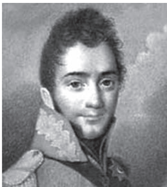
Граф Н.М. Каменский