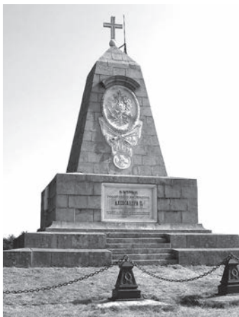
Болгария. Памятник русским воинам на Шипке

вом, и 10-й день августа зазорил. Уже на рассвете турецкие войска пошли на нас, и началась стрельба. Турок не стал нападать, как в первый день, и без толку гибнуть у неприступных линий обороны, а направился в обход, опираясь на поддержку артиллерии. Защитники все усилия прилагали, чтобы тому воспрепятствовать, но тщетно — неравны были силы, и к вечеру — часов около шести — враг оказался с восточной и западной сторон. Как стемнело, прекратились атаки, однако бодрость и готовность к бою были необходимы нашим воинам, и сохраняли защитники их всю ночь.