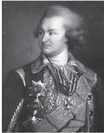
Князь Г.А. Потемкин

или уездов, откуда набирались призывные контингенты милиционных формирований. Таким образом конный полк Львова был переименован в Орловский конный полк украинской ландмилиции. Впоследствии ландмилицкие части были преобразованы в пехие, а в 1767 г. — в пехотные полки, образовавшие Украинскую дивизию. Название соединению было дано по наименованию Украинской укрепленной линии, где однодворцы великоросских уездов на протяжении полувека охраняли рубежи империи от вторжений крымских татар и мятежей малороссийского казачества.