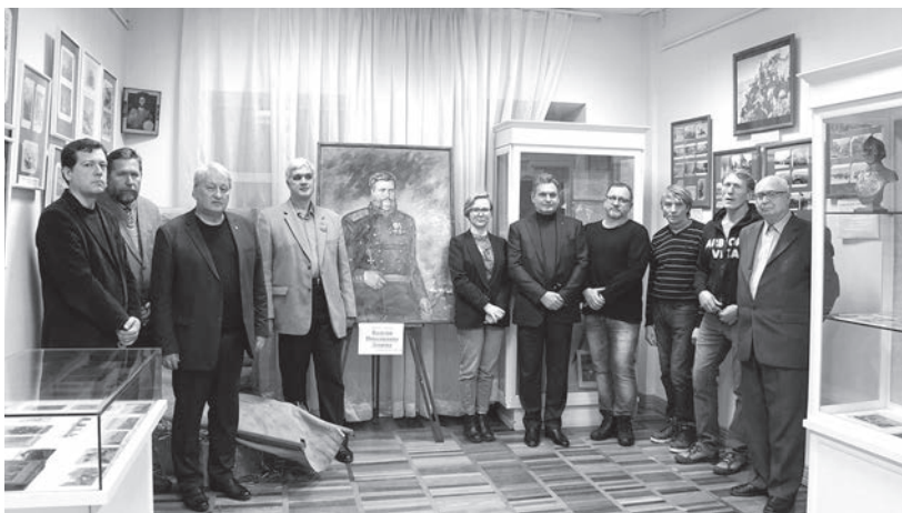
Открытие выставки в краеведческом музее

Когда болгарское правительство и парламент приняли документ, определяющий Россию как врага Болгарии, срочный социальный опрос показал, что 85% болгар воспринимают Россию как друга и не согласны с другим определением России. 85% людей в Болгарии любят Россию и делают все возможное, чтобы сохранять и развивать наши отношения».