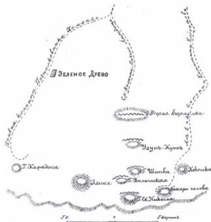
Схема № 31.

В 8 часов утра выступила обходная колонна, а главные силы — в 10 часов вечера. К обеим колоннам были приданы проводники из болгар, хорошо знающих эту местность.