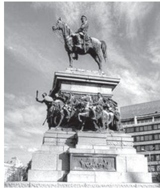
Памятник Александру II в Софии. Болгария