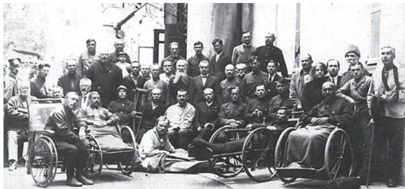
Дом инвалидов на Шипке

прещалось. Страна потеряла около 11 тысяч квадратных километров территории с населением более 400 тысяч человек: четыре приграничных округа отошли к КСХС, Южная Добруджа — к Румынии, Западная Фракия — к Греции. Население этих областей возвращалось в Болгарию, требовалось обеспечить обездоленных людей работой и жильем, оказать им материальную помощь. И тем не менее даже в такой отчаянно тяжелой ситуации правительство страны изыскало средства для помощи иностранцам — русским эмигрантам.