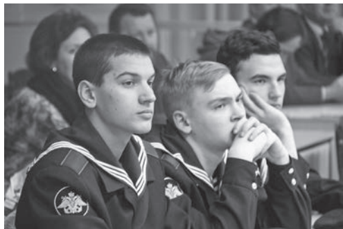
Клуб «Морпехи» (г. Орел)

религия, общее цивилизационное восприятие, общие культурные и духовные ценности. Русско-турецкую войну 1877–1878 гг. можно считать кульминацией наших связей. Возможно, для вас это девятая русско-турецкая военная кампания, а для нас это война Освободительная. И до, и по-