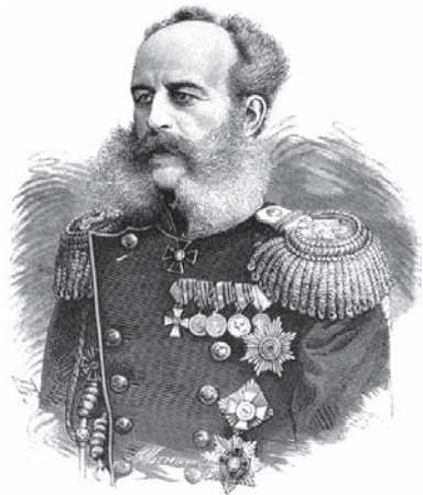
Начальник 9-й пех. дивизии князь Н.И. Святополк-Мирский

ГОРНИЧ-ГЕРНИЦКИЙ ИЛЬЯ — прапорщик 36-го пех. Орловского полка. Погиб.