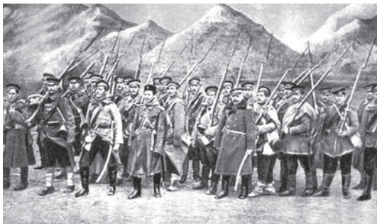
Суздальский полк на марше

каны в распоряжение отряда генерала Черняева, оказывавшего помощь с оружием в руках сербам и черногорцам, поддержавшим восстание в Боснии и Герцогине против многовекового османского ига. По разным данным добровольцами