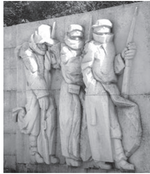
Скульптурная композиция «Русские солдаты на Шипкинском перевале зимой 1877 г.»

Ночь прошла. Утренняя заря появилась, следом и солнце. Сло-