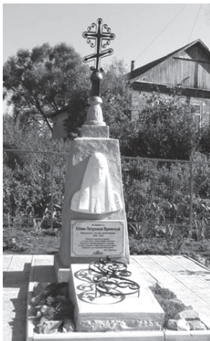
Памятник Ю.П. Вревской в селе Лески Малоархангельского района

Если ты, читатель, обратил внимание, то год, в течение которого проводилась 10-я перепись населения, совпал с датой гибели генерал-лейтенанта Вревского, но Ипполит Александрович ещё значится в этих документах живым. Поскольку детей законнорожденных от брака с Юлией Петровной Варпаховской у героя Кавказской войны не успело появиться, а дети от горянки не имели права наследования, то все орловские имения И. А. Вревского перешли частью к племяннику генерала, Александру Борисовичу Вревскому, частью — к юной вдове, Юлии Петровне. Одно из своих имений баронесса Вревская и продала для организации санитарного поезда, с которым отправилась на помощь раненым. И там, в других горах, Балканских, и на другой войне, русско-турецкой, 20 лет спустя её беспокойная душа соединилась, наконец, с душой любимого мужа, чтобы не расставаться им уже никогда.