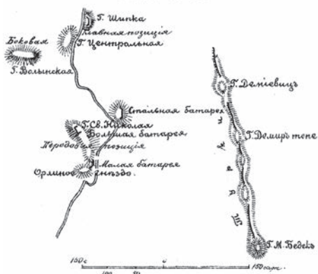
Схема № 32.

ние их направить главный удар на Стальную батарею. Ввиду этого генерал Столетов в 9 часов утра двинул туда из резерва 1-ю и 4-ю болгарские дружины и 4-ю и 1-ю стрелковые роты Орловского полка. Около 10 часов утра турки начали наступать вдоль дороги из деревни Шипки. К этому времени на горе Святого Николая находилось 7 рот Орловского полка. Турки