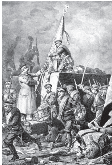
Бой под Горным Дубняком 12 октября 1877 года

Захоронен генерал Лавров был непосредственно в склепе Введенской церкви, стоявшей на высоком берегу речки Березуйки. Сельское поселение это, находившееся несколько в стороне от самого Кривцово, состояло из 3-х домиков церковных служителей (13 жителей) и называлось с. Березуй (Введенское) («XXIX. Ор-