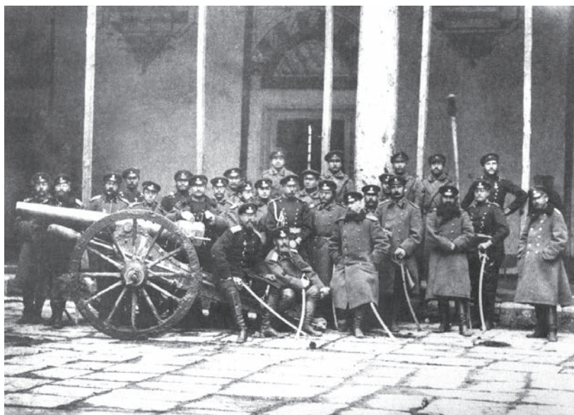
Гвардейская гренадерская артиллерийская бригада