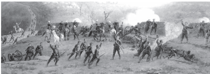
А.Д. Кившенко. Сражение на Шипкинском перевале 11 августа 1877 г.

Ополченцы, сосредоточившись на позициях, пели беспрестанно целый день: то «Шумит Марица», то «Не хотим мы денег, не хотим богатства, но жаждем свободы, равенства и братства», то «Вперед, там ждет нас слава, на бой, герои-львы».