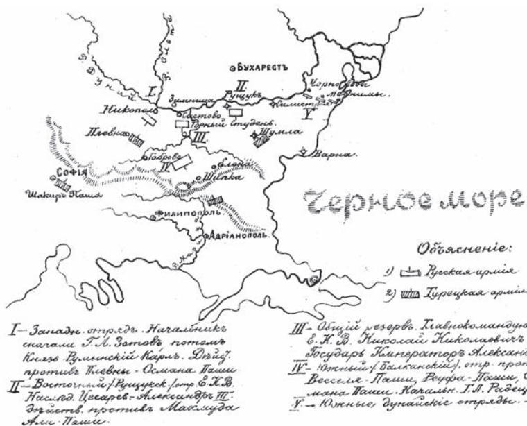
Схема № 29

лонну, в состав которой вошли: отряд генерал-майора Скобелева, 11-я кавалерийская дивизия генерал-майора Татищева, 14-я пехотная дивизия Драгомирова и 9-я пехотная дивизия князя Святополк-Мирского 2-го. Эта колонна предназначалась для действия на Балканах, чтобы препятствовать прорыву армии Сулеймана-паши через Балканы, так как он стремился подать помощь Осману-паше под Плевной. Впереди VIII корпуса действовал отдельный кавалерийский отряд генерал-лейтенанта Гурко. К 26 июня весь VIII корпус был сосредоточен у деревни Царевича (схема № 30) к югу от Систово, прикрывая переправу через Дунай.