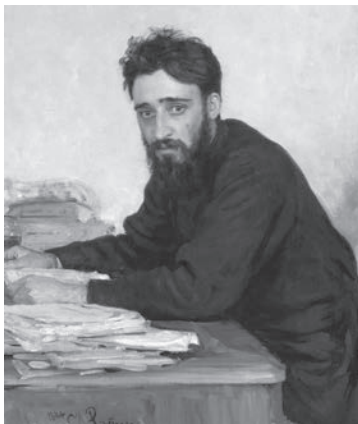
В. М. Гаршин. Портрет работы Ильи Репина

Неприятель, не выдержав сильного натиска, стал в беспорядке отступать к Разграду. Генерал Тихменёв сообщал в донесении: «Бой при Есерджи (Езерче) чисто солдатский. Не было предела их молодечеству, отваге и находчивости». Из показаний пленных турок стало известно, что против русского отряда сражались три пехотных полка, 6 орудий и шестьсот кавалеристов. Это были отборные части — янычары.