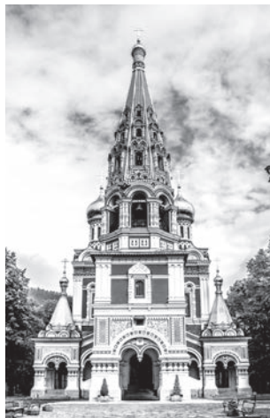
Храм Рождества Христова

В 1902 году на южной стороне Шипкинского перевала, в окрестностях города Шипки, был освящен Храм-памятник Рождества Христова — первый и наиболее величественный из более 400 памятников болгарско-русской дружбы на территории Болгарии. Внутри храма в 17 саркофагах упокоены воины — защитники Шипки. Имена многих героев — болгар и русских — выбиты на 34 мемориальных досках, где также указаны воинские подразделения, принимавшие участие в боях у городов Казанлык и Стара-Загора. Колокола храма вылиты в России военным ведомством из 30 000 стрелянных гильз. Самый большой колокол, подаренный Императором Николаем Вторым, весит 11 643 кг.