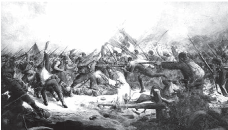
Бой под Разградом