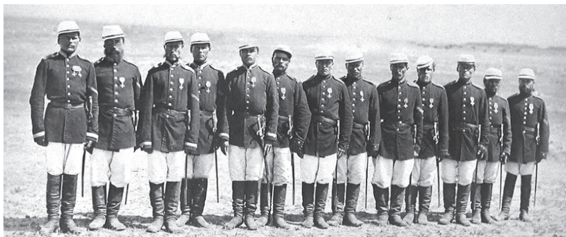
Георгиевские кавалеры, участвовавшие в освобождении Болгарии

До конца существования русской императорской армии это награждение широкими Георгиевскими лентами оставалось единственным.