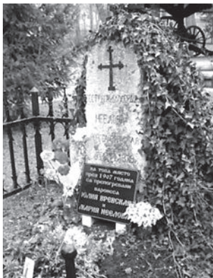
Могила Ю.П. Вревской

глазами; добра — бесконечно. Ты можешь подумать, что описание это вызвано моим влюблённым состоянием, но успокойся, это голос всеобщего мнения».