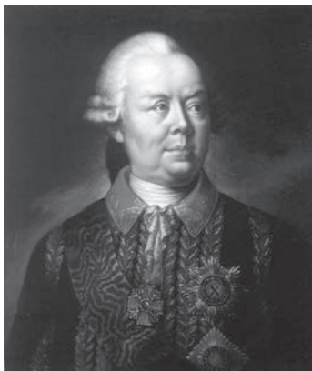
Граф П.А. Румянцев