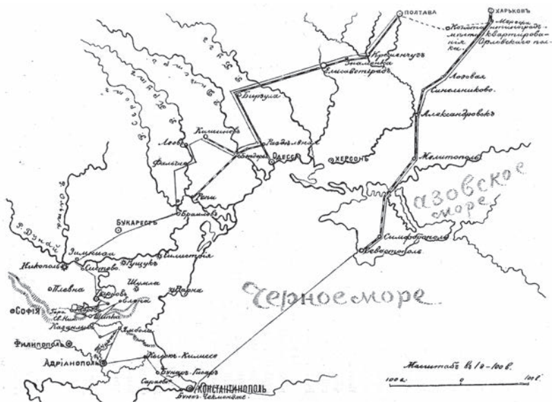
Схема № 28

и удостоились похвалы за свой боевой вид, причем всем нижним чинам было выдано по 50 копеек, а имеющим знак отличия Военного Ордена и шевроны — по 3 рубля. 12 апреля 1877 года, то есть на другой день после Высочайшего смотра, орловский полк выступил из Тирасполя, следуя через Бендеры в Румынское княжество. 21 апреля он вступил в город Леово, расположенный на границе Румынии. Император Александр II, имея наготове армии, все еще надеялся покончить миром с Турцией, если она исполнит его требования; но турки упорно не желали этого, подстрекаемые нашими недоброжелателями. Ввиду этого 12 апреля 1877 года Александр II объявил войну Турции. Этот манифест об объявлении войны был прочитан Орловцам, когда они находились в Леово, и все только и желали наказать врага за его жестокости по отношению к христианам.