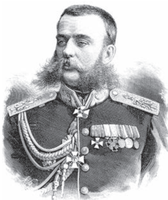
Генерал М.Д. Скобелев