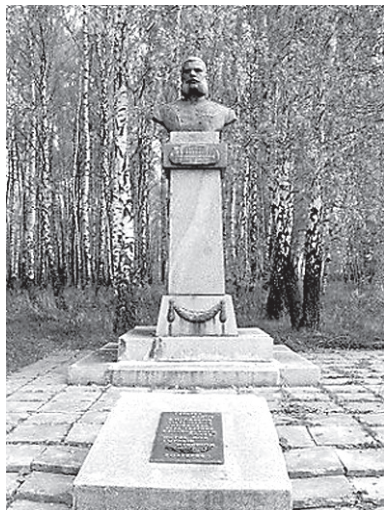
Памятник на могиле генерала рядом с комплексом «Кривцовский мемориал» в Болховском районе Орловской области

Из века в век растет о крае слава, Из года в год крепится его честь. Герои, говорят, не умирают! Всегда герои были, будут, есть!