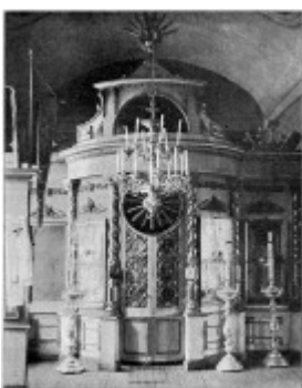
Рис. 16. Внутренний вид церкви в селе Сретенское (1909 г.).