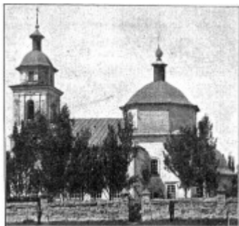
Рис. 13. Село Сретенское. Церковь (1742 г.).