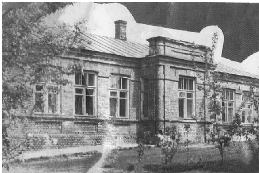
Село Сретенье. 8-летняя школа. Построена в 1894 г. 1962 г.