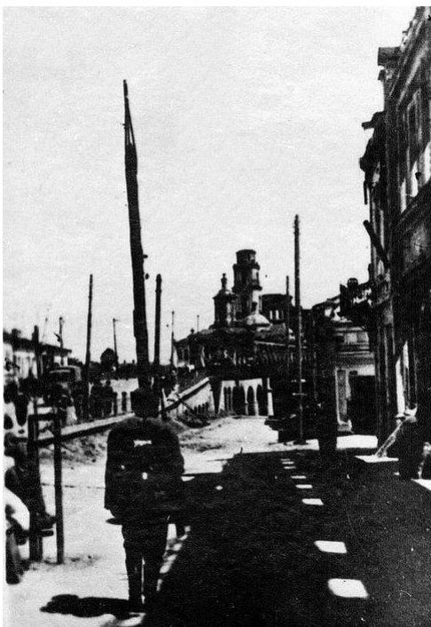
Орёл в период оккупации. Преображенская церковь. Торговые ряды. 1943 г.

открылась биржу труда для ежедневной регистрации жителей (в возрасте от 14 до 55 лет), не имевших постоянной работы. Там же орловцев заставляли подписывать «трудовые обязательства» о добровольной поездке в Германию. В районах вербовка проходила планомерно из числа физически крепких и здоровых людей на основании поступавших разнарядок. Фашисты расклеивали листовки-обращения, призывающие население к добровольной поездке в Германию: «... Для поездки Вы должны в местной комендатуре получить пропуск. На сборном пункте Вы получите общежитие и бесплатное питание. Ежедневно Вы получите хлеб, мармелад и хороший суп на обед. Вы должны взять с собой кружку, миску для еды, ложку, вилку и т.д. Привозите с собою Ваши музыкальные инструменты: гитары, мандолины, балалайки, гармоники и т.д., чтобы Вы могли играть на сборном пункте, в пути и в свободное время в Германии ».