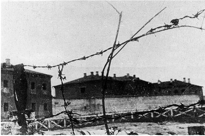
Орловский концлагерь. 1943 г.

Лагерь военнопленных в г. Орле, устроенный на территории городской тюрьмы по ул. Красноармейской, являлся одним из крупнейших созданных фашистами на оккупированной территории и назывался «Сборный пункт № 20 2-й танковой Германской армии». В его ведомстве находились лагерь в д. Железнице и каменные карьеры (Болховское шоссе, 7 км). В корпусах орловской тюрьмы, обнесенной колючей проволокой, было устроено несколько блоков (корпусов) для содержания заключенных. Все прибывшие военнопленные проходили через 5-й «карантинный» блок, после врачебного обследования тяжелобольных направляли в 6-й блок, с «легкими случаями» – в 4-й блок, с инфекционными заболеваниями – в «заразный» барак. В 1-м блоке содержались заключенные, совершившие «особо опасные преступления» против фашистов, в том числе партизаны, в 7-ом – «военнопленные для работ».